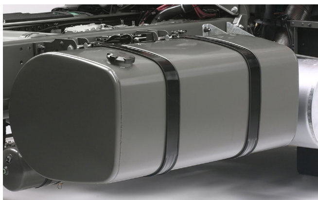
Depósito de combustível em aço montado no lado direito.