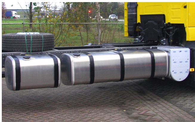
Depósitos de combustível em alumínio no lado direito (R885A56).