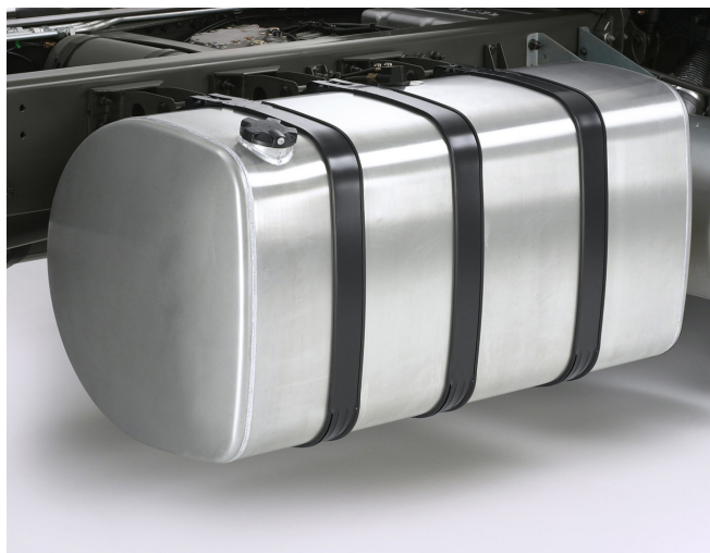
Depósito de combustível em alumínio no lado direito.