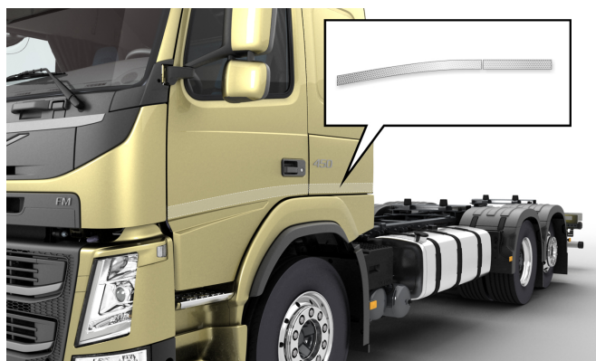
REFS-CW: Tiras reflectoras brancas montadas na parte lateral da cabina.