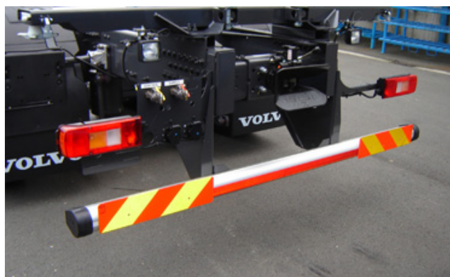
REST-RUP: Tiras reflectoras vermelhas montadas na protecção inferior traseira.