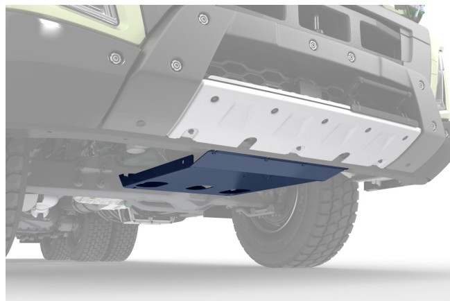
GUARD-EH, eixo dianteiro motriz.