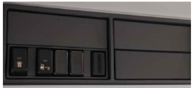
Compartimentos ISO acima do para-brisas, lado do motorista.