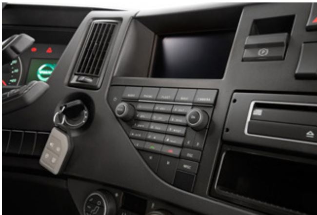
Instrumentos que proporcionam uma ergonomia excelente.

Os instrumentos da cabina têm um design simples e lógico com controlos convenientes e de fácil utilização. As informações do motorista são fornecidas através de um display no painel de instrumentos. A central elétrica está posicionada num local protegido ao centro do painel de instrumentos, juntamente com diversos componentes elétricos e fusíveis. O camião tem uma central elétrica independente para a superestrutura, colocada junto aos pés do passageiro.