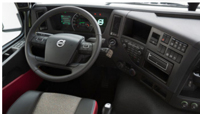
Está disponível um conjunto de cores opcionais para o interior. Para mais informações, consulte a folha de especificações dos acabamentos interiores.

motor são facilitadas pelo ângulo de basculamento da cabina de 70°. Para facilitar a limpeza do para-brisas, está disponível em opção um degrau retrátil no para-choques, combinado com uma pega na grelha frontal.