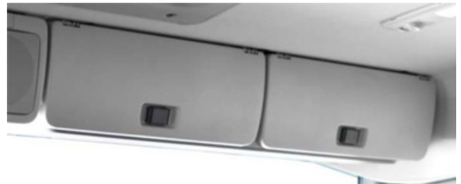
Compartimentos para arrumos acima do para-brisas, no lado do passageiro.

Os bancos têm um design ergonómico e estão disponíveis com diversos níveis de acabamento (suspensão pneumática, ventilação das almofadas, aquecimento e muito mais). Os estofos podem ser em vinil, tecido, veludo ou couro. Está disponível também a opção de microfone e altifalante integrados no apoio para a cabeça. Também está disponível, como opção, um banco com cinto de segurança integrado.