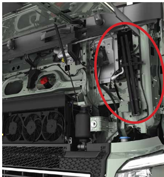
As ferramentas de basculamento da cabina encontram-se atrás da grelha frontal.